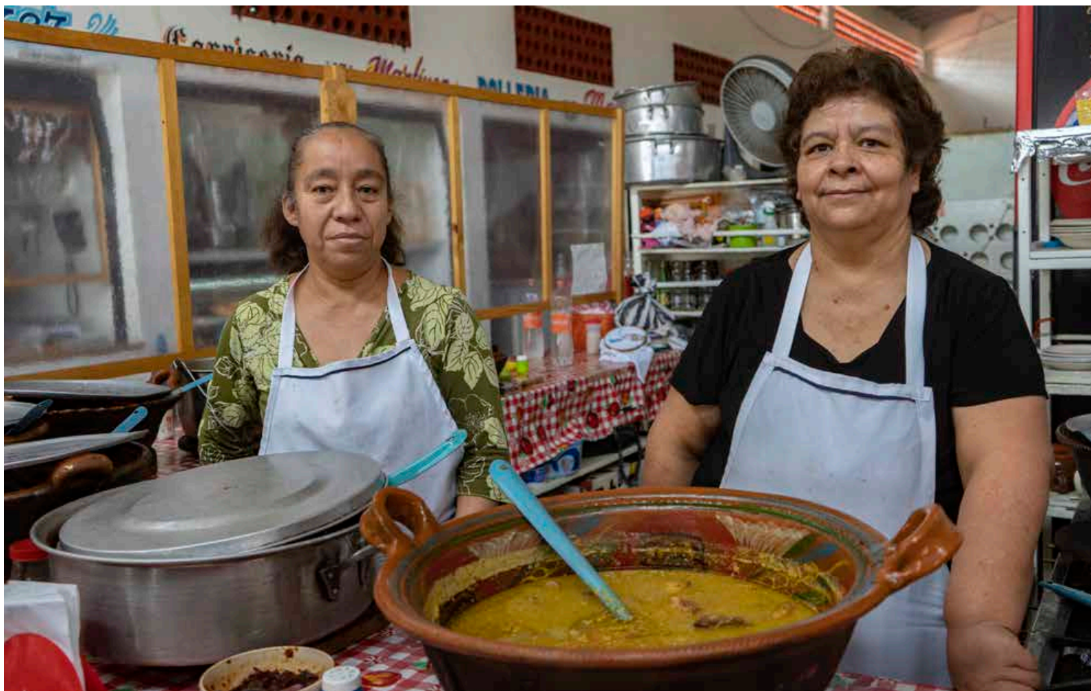
Tonatico tiene una rica variedad de platillos y comidas.