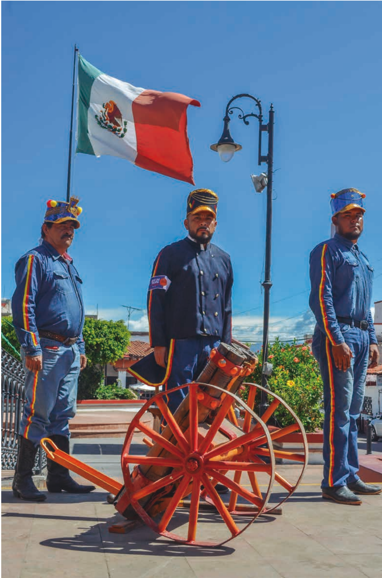
Páginas 36 y 37: vestuario de la tropa de los Españoles, sus colores distintivos son el rojo y amarillo.