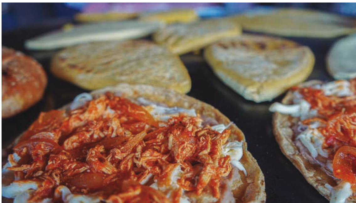
Una de las comidas más recurridas son los sopes y las gorditas.