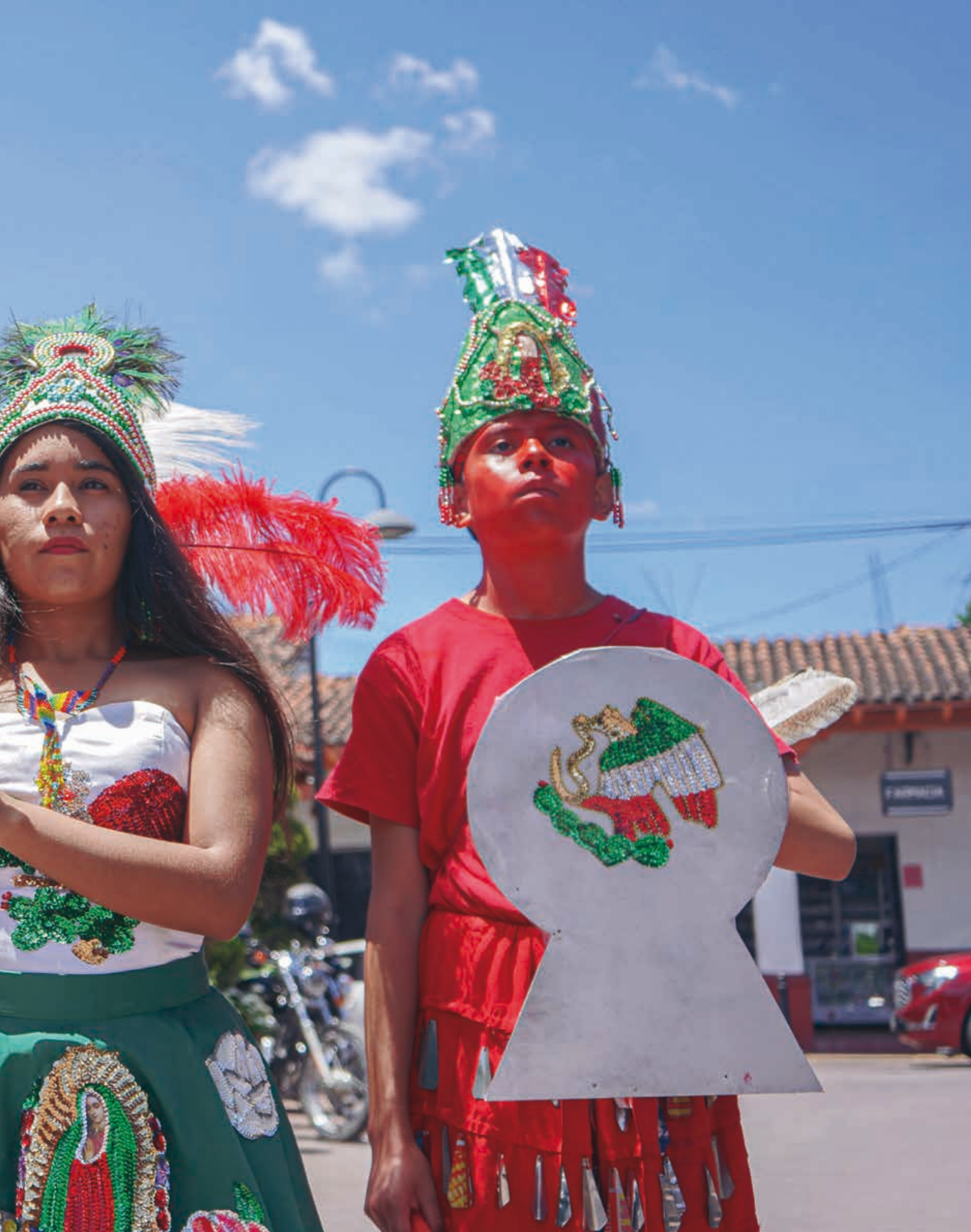
Páginas 27-31: parafernalia de los Apaches, distintiva por el uso de una corona de carrizo.