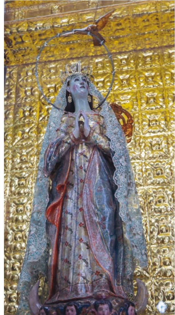
Izquierda: al fondo, retablo del Santuario de Nuestra Señora de Tonatico.