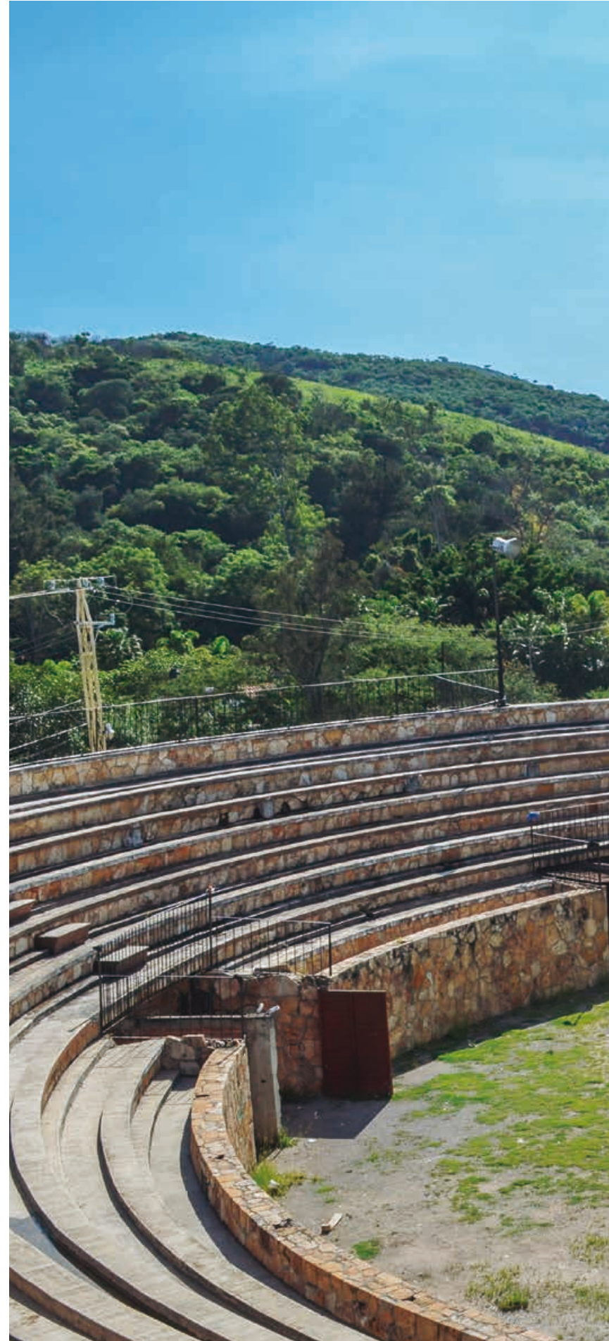
Plaza de toros.