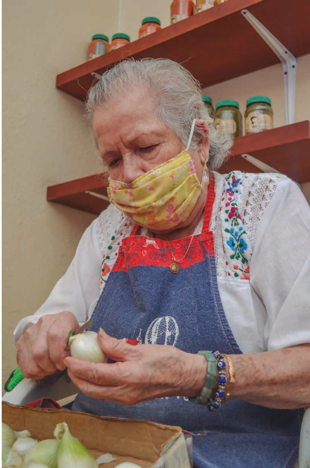
Página 62 y 63: selección y limpieza de cebollas para encurtidos.