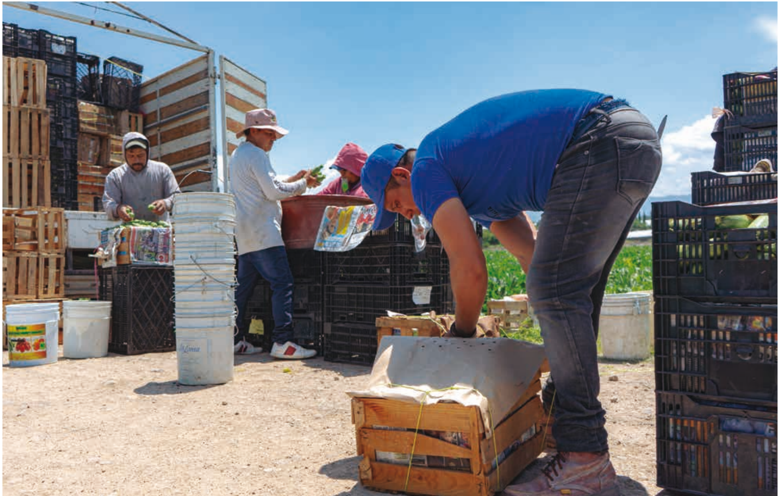
Página 88-93: producción, recolección, selección, limpieza y distribución de calabazas.