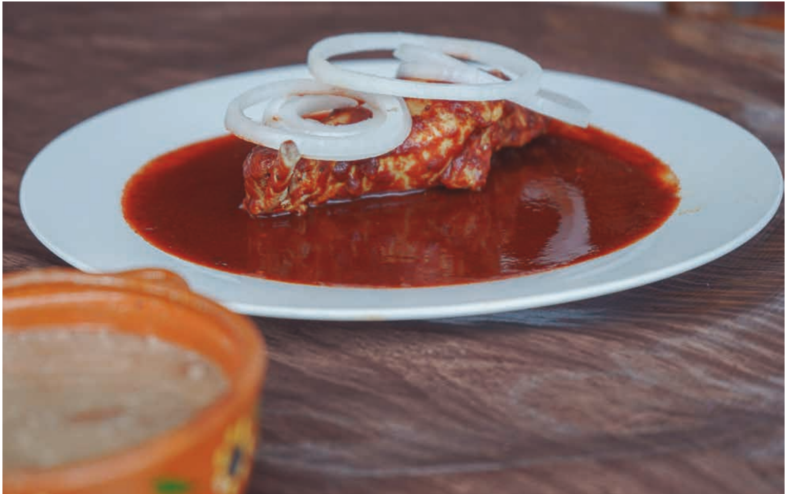
El conejo se prepara en salsa roja o chile guajillo.